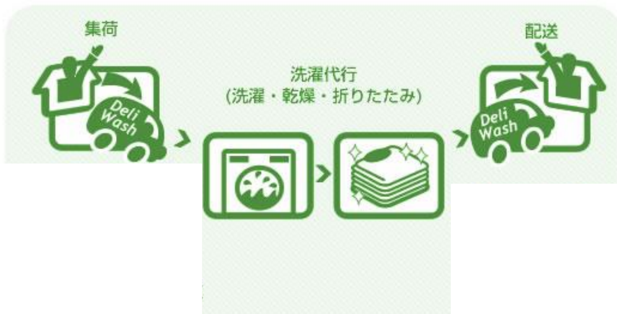
洗濯代行サービスのイメージ図

弊社では学校給食白衣の安全衛生管理を徹底し洗濯を受けたくまっております。 学校給食の白衣は、安全で衛生的でなければいけません。 そのことを理解して衛生的な作業を徹底しております。